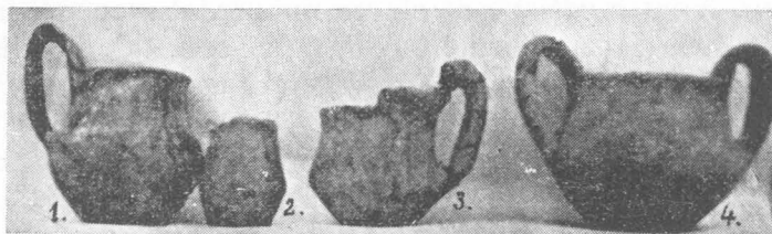
Fig. 190. — Obiecte descoperite în mormintele tumulare de la Telești.

Tot în cursul anului 1943 s-au făcut săpăturile din « Movila Călinii », situată pe malul Dunării, în apropierea satului Hunia. Scopul acelor săpături era acela de a lămuri