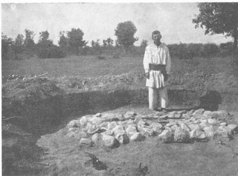
Fig 193. — Un mormint cu strat de pietre de la Drăgoești

În studiile arheologilor bulgari, pe care le-am putut consulta, n-am găsit menționate decît două necropole tumulare din nord-vestul R.P. Bulgaria. Acestea au fost săpate în parte de arheologii bulgari. Ele au dat materiale asemănătoare cu cele de la Balta Verde și Gogoșu. Mai importantă este întinsa necropolă tumulară care se află situată pe cursul superior al râului Vit, în vecinătatea satului Malka Breznița (reg. Teteven). Arheologii bulgari au efectuat aici sondaje doar în zece movilițe, dintre care cele mai multe fuseseră jefuite mai înainte de către căutătorii de comori. Unele morminte au scăpat însă neatinse. Astfel mormîntul neprofanat din movila 6 se aseamănă cu categoria acelor morminte de la Balta Verde, care au deasupra mortului o suprafață de pietre. La schelet s-au găsit două fibule de bronz. Una era în regiunea pieptului și alta mai jos. 1 Cele două fibule